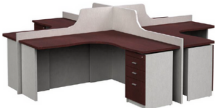
CENTRO DE TRABAJO