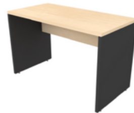
MESA DE TRABAJO

PREGUNTA POR NUESTRA VARIEDAD DE PRODUCTOS