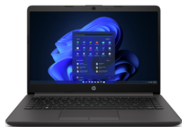
Laptops de diferentes marcas