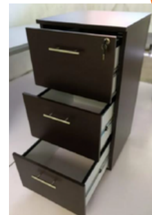
ARCHIVEROS, LIBREROS Y MULTIUSOS

*Las imágenes son ilustrativas y puede llegar a variar el producto y precio*