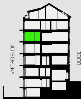
Řez domem Pozice bytu v rámci domu