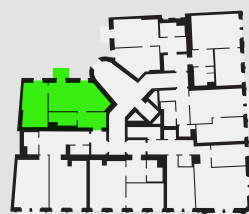
Půdorys podlaží Umístění bytu na patře

Podlahová plocha bytu dle nařízení vlády č. 366/2013 Sb. znamená celkovou plochu všech místností bytu a také plochy pod nosnými i nenosnými zdmi, přízdívkami a jádry (zde označené jako svislé konstrukce). Jedná se o plochu, která je vymezená obvodovými zdmi bytu. Plochy jednotlivých místností jsou pouze orientační. Vyobrazené zařízení v plánech bytů (nábytek, kuch. linka, el. spotřebiče atd.) není součástí dodávky. Rozsah dodávky je specifikován ve standardu. Developer si vyhrazuje právo na změny.