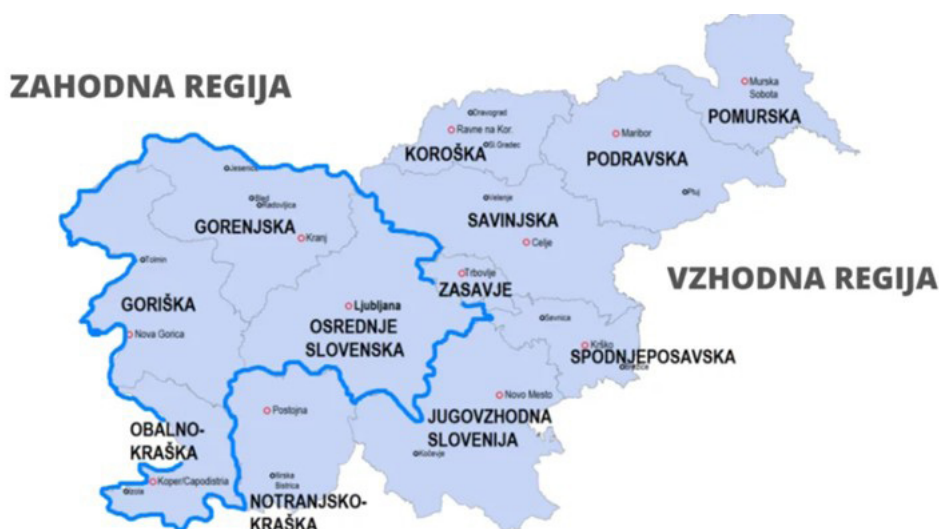
Slika 1: Delitev na zahodno in vzhodno kohezijsko regijo

Za določitev razmerja med programskima območjema se uporablja t. i. sorazmerni ključ, ki izhaja iz delitve sredstev v Programu 2021–2027, ki znaša 49,07 % KRZS in 50,93 % KRVS.