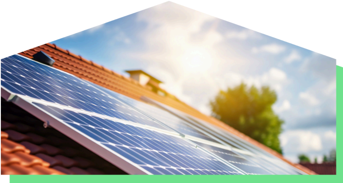
Sonne auf PV-Anlage