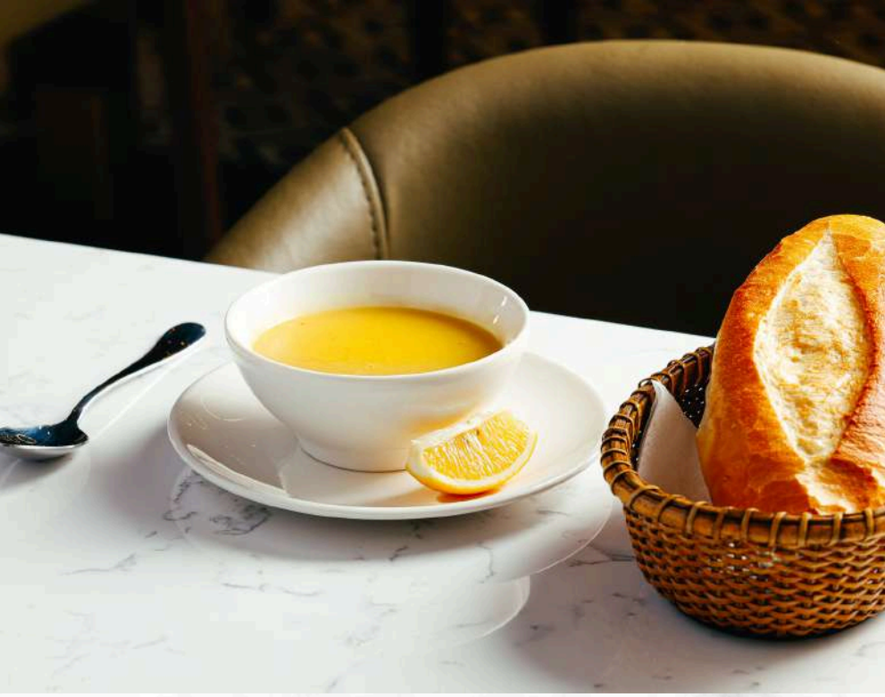
TÜRKISCHE LSENSUPPE 4,90€ Mercimek Çorbası A,G,L