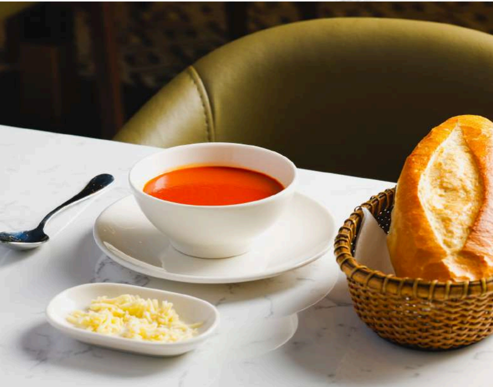
TAGESSUPPE 5,90€ Günün Çorbası A,G,L