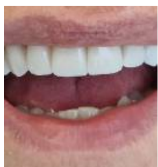
Un caso reale gestito dal Dott. Vezzoli con le faccette: «prima» (in alto) e «dopo» (in basso)