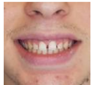
Un paziente dello Studio Dentistico Eurodent con le faccette: «prima» (in alto) e «dopo» (in basso)

Lo conferma l'esperienza dello Studio Eurodent, punto di riferimento sul territorio per chi cerca soluzioni efficaci, personalizzate e orientate al benessere complessivo della persona.