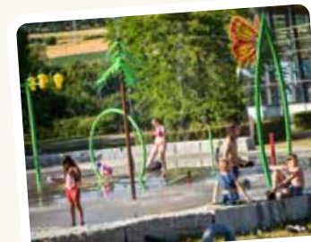
erfrischend, wild, Freude pur