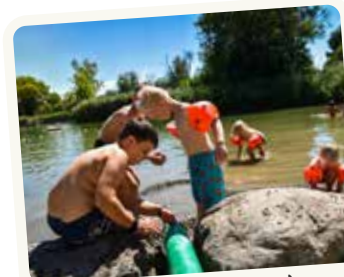
Sonne, Sand und Seegefühl