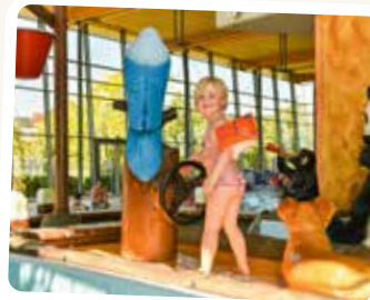
rutschen, planschen, lachen