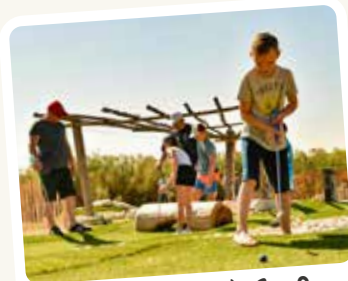
Treffer, Jubel, Spaß für alle