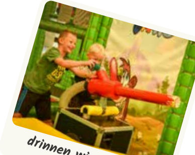
drinnen wie draußen toben