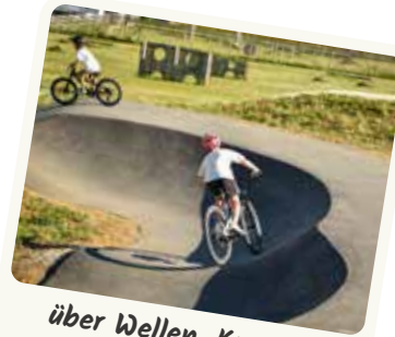
über Wellen, Kurven, Spaß