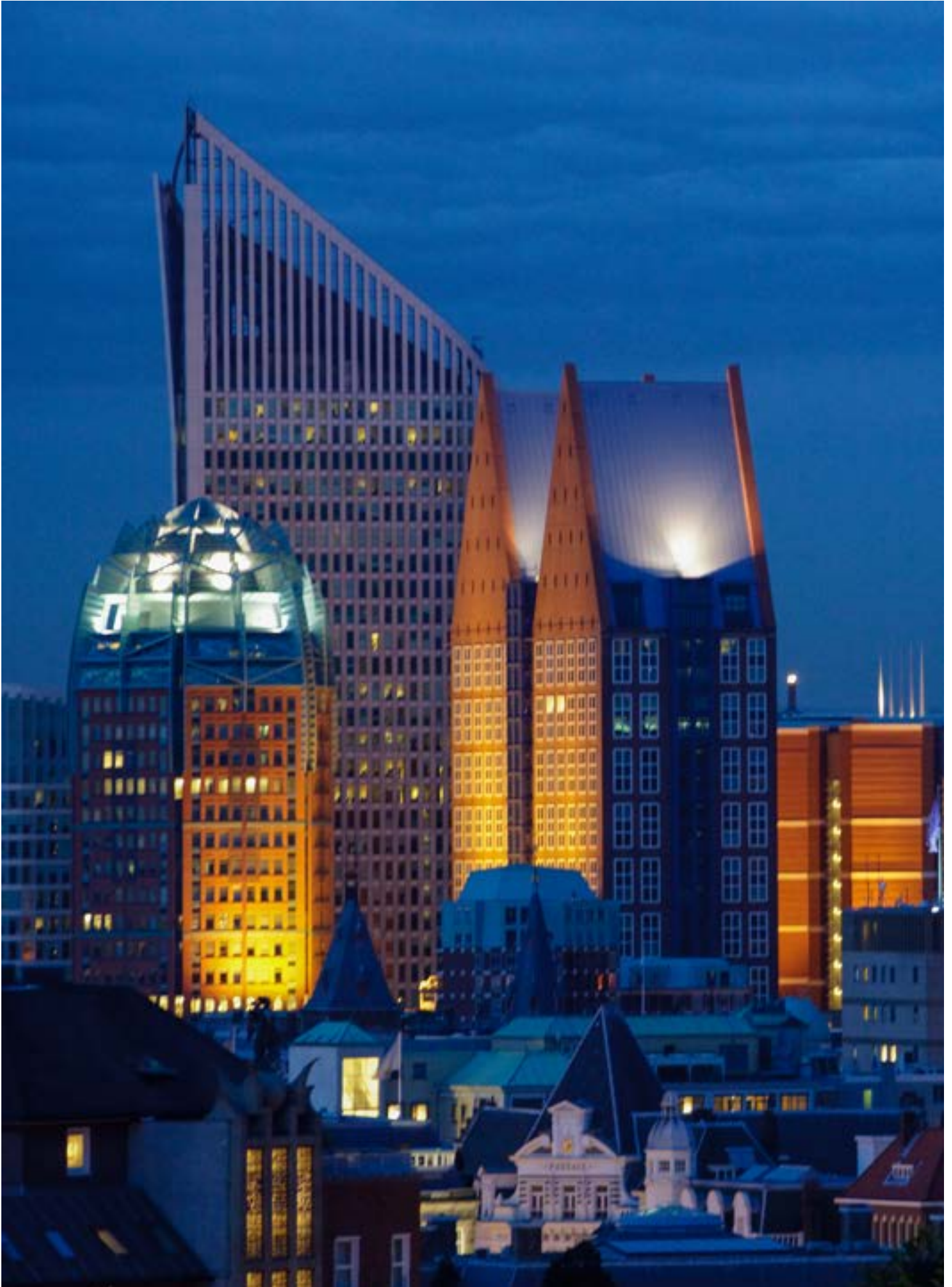
Skyline van Den Haag met de moderne kantoorgebouwen van diverse ministeries bij avond