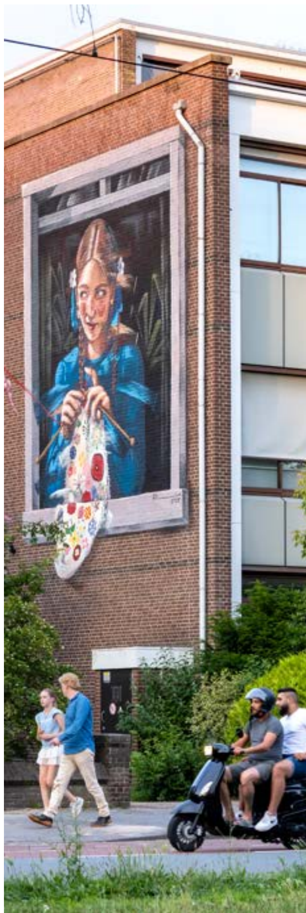
Een muurschildering vanwege de NAVO-TOP

Tsa fungeert als stevig en fris adviescollectief voor de gemeente Den Haag. Het Tsa heeft sector-, beleid-, programma- en projectoverstijgende kennis van inhoud op maatschappelijke vraagstukken en stedelijke transitie, van waaruit nieuwe inzichten en kennis kunnen ontstaan. Het Tsa neemt er geen genoegen mee dat mensen in Den Haag (los van rol, functie of afkomst) zich geen onderdeel voelen van de toekomst van de stad. Het Tsa werkt transparant en wil een voorbeeldrol vervullen op inhoud, vorm en verbinding. Op deze manier ontwerpt het Tsa vanuit de tussenruimte aan een integraal, duurzaam en inspirerend perspectief voor het Den Haag van morgen. Het Tsa is toegankelijk, begrijpelijk en biedt verhalen die vooruit vertellen. Dit doet het Tsa zowel gevraagd als ongevroegd, dit laatste als het daartoe meerwaarde ziet.