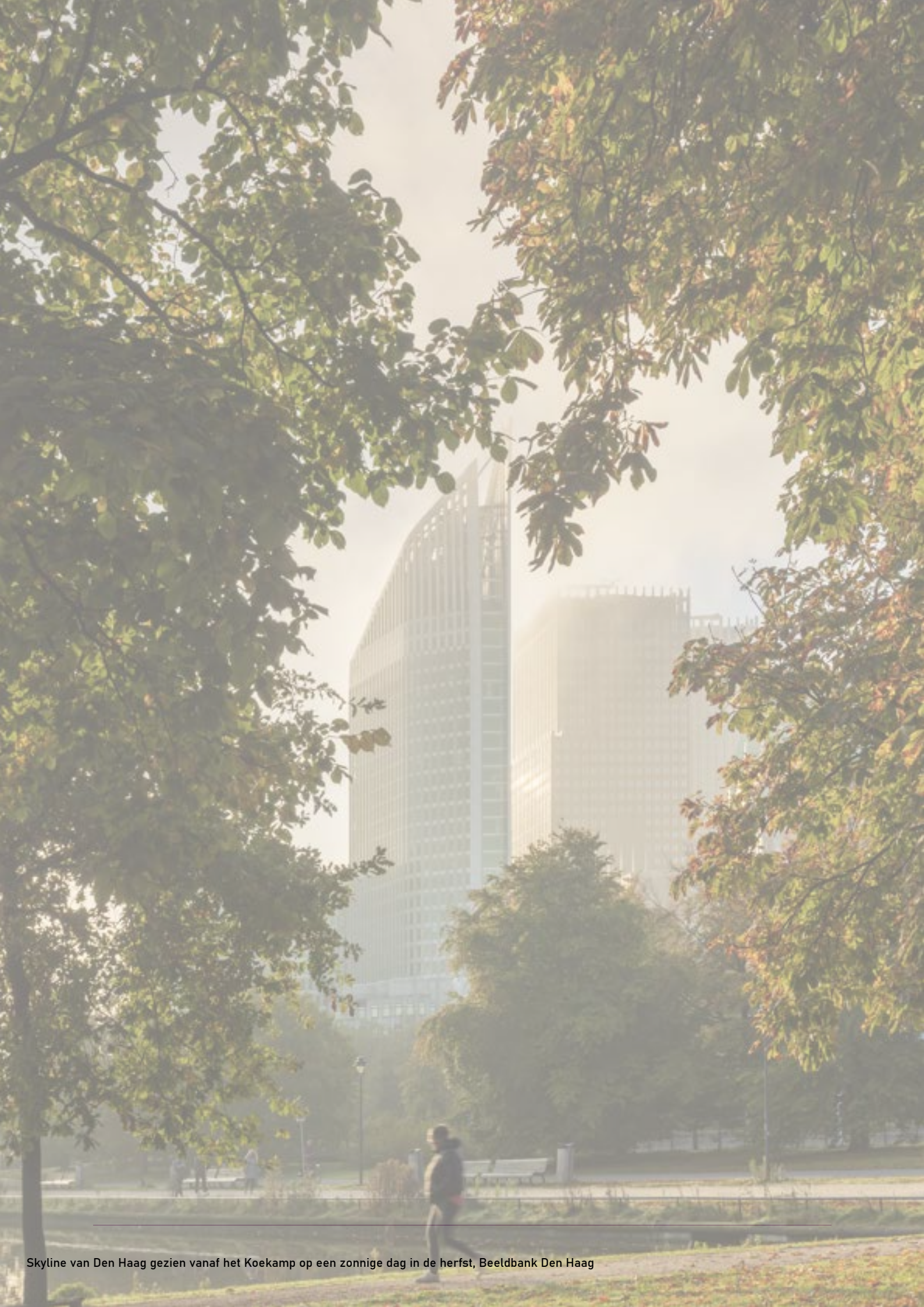
Skyline van Den Haag gezien vanaf het Koekamp op een zonnige dag in de herfst