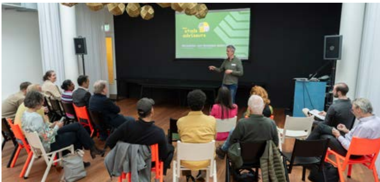
Werkatelier 'een duurzaam stadsverhaal', In Theater Dakota.

Het advies wordt – samen met een reactie van het college – in Q1 2026 aan de raad aangeboden en is vanaf dat moment te vinden op de website van het Tsa en via het RaadsInformatie Systeem (RIS) .