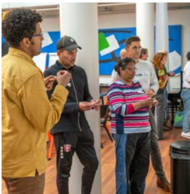
Werkatelier Theater Dakota (Zuidwest)

Voor het advies 'Vier lenzen op duurzaamheid' organiseerde het TSa twee werkateliers, waarin een brede vertegenwoordiging uit de stad samenkwam. Bewoners, ondernemers, en vertegenwoordigers uit het onderwijs, de cultuur en sportorganisaties die zich inzetten voor een duurzamer Den Haag, werkten samen met ambtenaren van de gemeente die actief betrokken zijn bij duurzaamheid. Voor deze werkateliers werd bewust gekozen voor twee contrasterende wijken in Den Haag. Het eerste atelier vond plaats in Escamp (Zuid-West), een wijk met sociale uitdagingen en veel bewonersinitiatieven zoals De Ruilbank, die een inspirerende opening van het atelier verzorgde. Het tweede atelier vond plaats in het Statenkwartier, waar inwoners het over het algemeen breder hebben en het duurzame en sociale ondernemersinitiatief Sox2Sox een podium kreeg. Zij inspireerden de deelnemers om anders te denken over duurzaamheid en ondernemen.