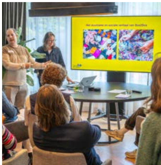
Werkatelier Hybrid Offices (Statenkwartier)