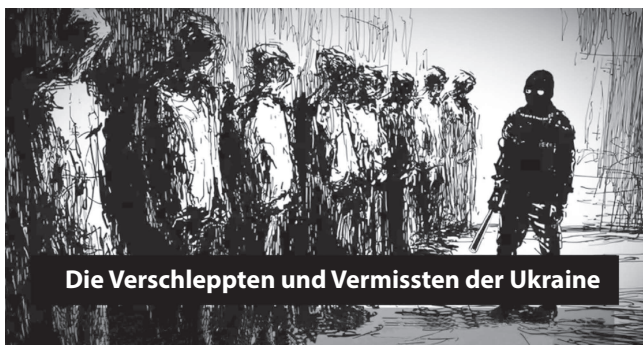
Die Verschleppten und Vermissten der Ukraine

Parallel dazu entsteht ein internationales Entschädigungssystem für Kriegsopfer. Die Staaten des Europarates unterstützen zudem die Einrichtung einer Internationalen Kommission zur Prüfung von Entschädigungsansprüchen, die mit dem internationalen Schadensregister zusammenarbeiten soll, bei dem bereits mehr als 150'000 Gesuche eingegangen sind. Für uns ist jedoch etwas Grundsätzliches entscheidend: Opfer dürfen nicht bloss Objekte von Schutzmechanismen bleiben. Sie müssen aktiv an deren Gestaltung beteiligt sein. Deshalb hat sich ALUMNI einem offenen Schreiben an den Europarat angeschlossen, initiiert von der Organisation REDRESS, das eine reale Beteiligung von Überlebenden und der Zivilgesellschaft am Aufbau der künftigen Entschädigungskommission fordert.