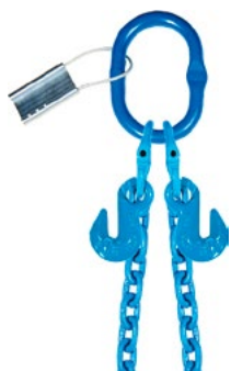
CHARGES MAXIMALES D'UTILISATION (CMU OU SWL) EN TONNES