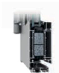
DVEŘE MB-79N SI+