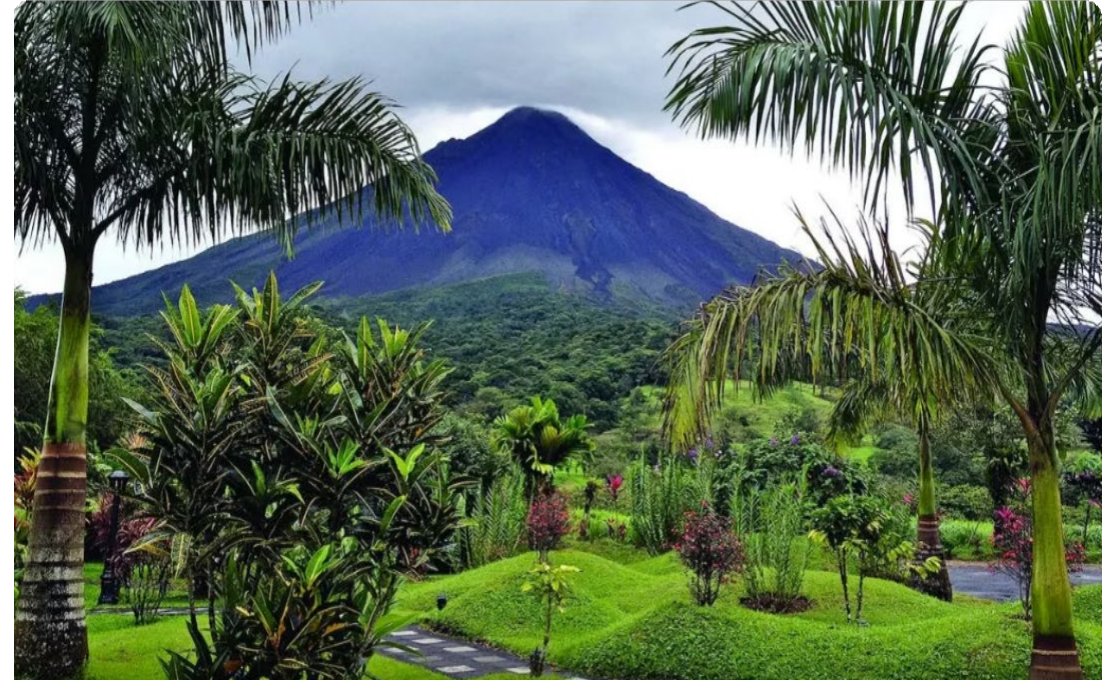
Volcán Arenal - Símbolo del liderazgo costarricense en turismo sostenible

Principales productos: Dispositivos médicos (44%), piña (7%), banano (6%), jarabes y concentrados (4%), café (2%)