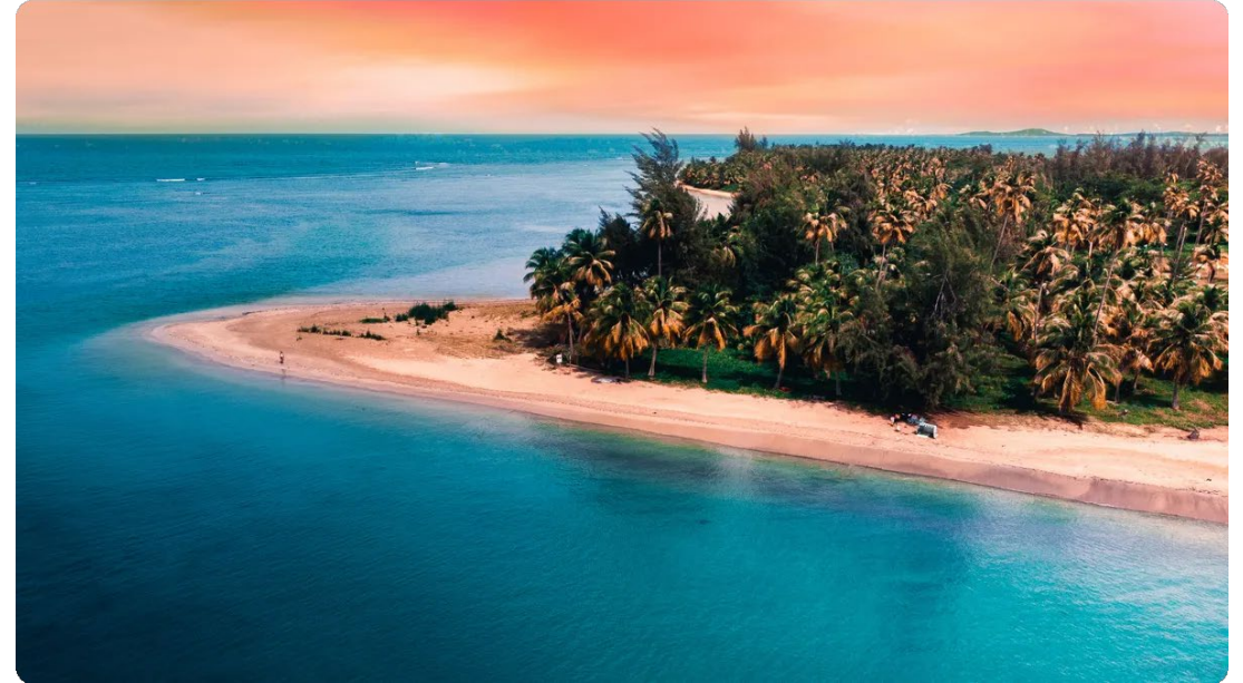
Playa de San Juan - Hub turístico y económico

"Puerto Rico mantiene una posición estratégica para el comercio entre EE.UU. y el Caribe, con industrias de alto valor agregado."