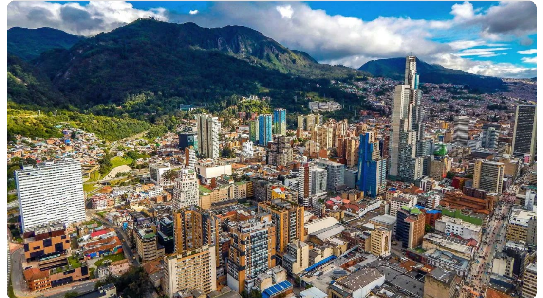
Bogotá, capital de Colombia - con vista a los Andes

"Colombia ha mantenido la estabilidad macroeconómica a través de instituciones sólidas, pero necesita mayor diversificación para impulsar la productividad y la convergencia con economías de altos ingresos."