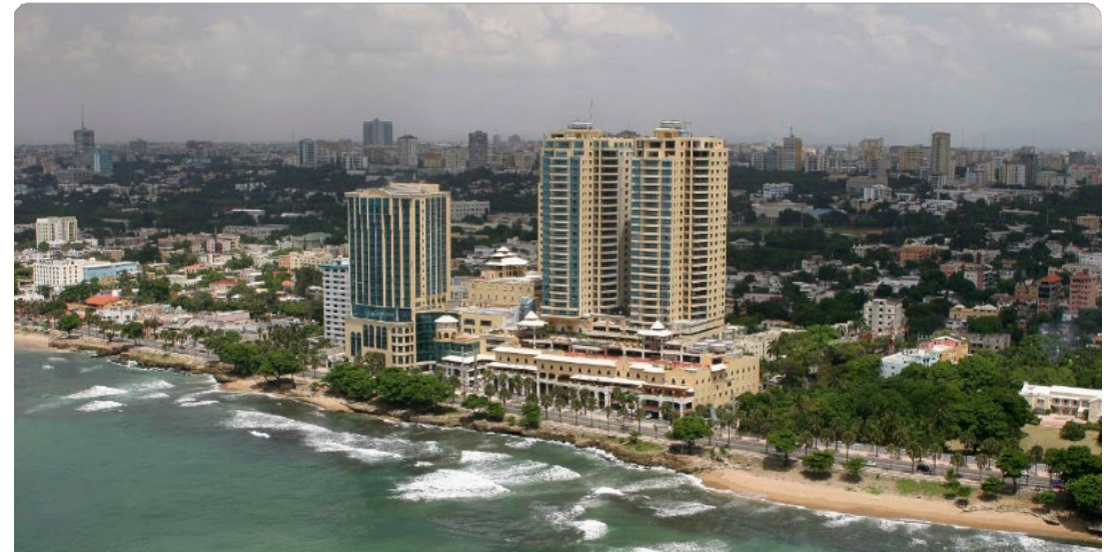
Santo Domingo, capital y centro económico de la República Dominicana

"Las exportaciones de abril 2024 alcanzaron un récord histórico con crecimiento interanual del 55% respecto a 2019."