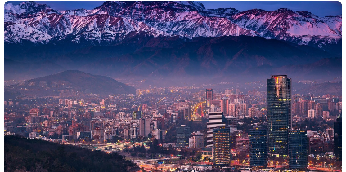
Santiago de Chile con la majestuosa Cordillera de los Andes al fondo

"Chile lidera la región en apertura comercial con más de 30 acuerdos comerciales que cubren el 88% del PIB mundial"