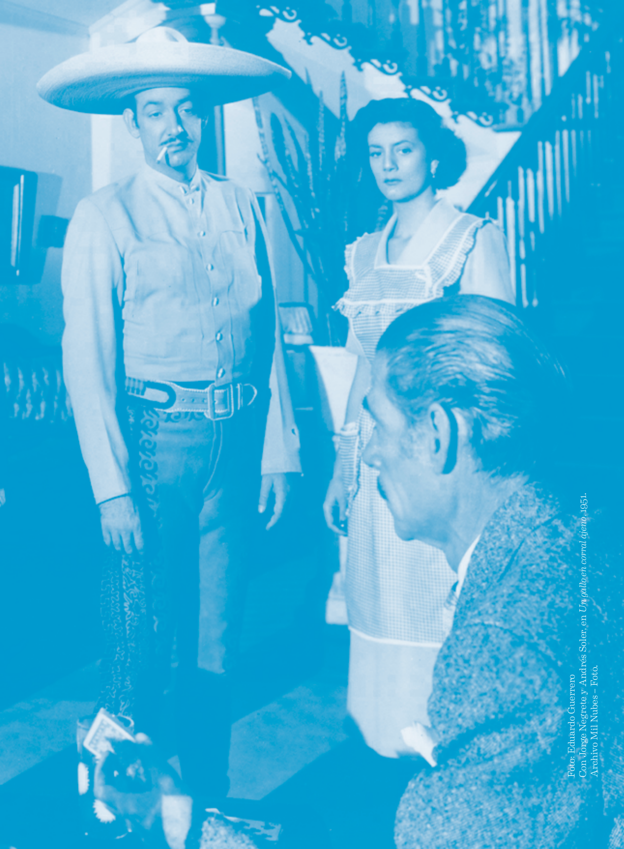
Con Jorge Negrete y Andrés Soler, en Un gallo en corral ajeno , 1951.