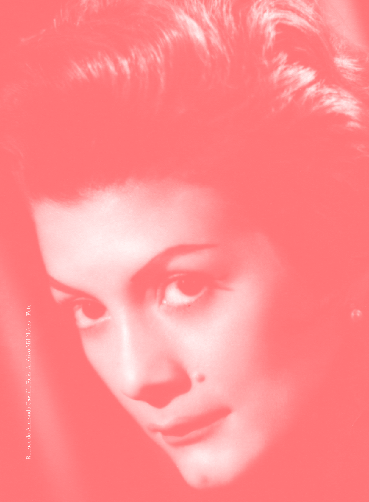
Retrato de Armando Carrillo Ruiz.