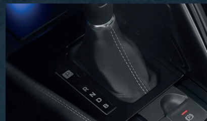
Freno de mano electrónico (EPB) con función "Auto-Hold"