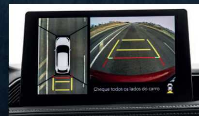
Cámara de estacionamiento 360°