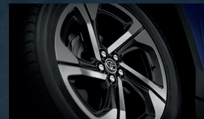
Llantas de aleación de 18"