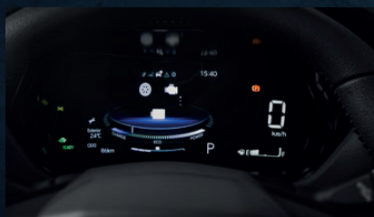
Computadora de abordo TFT con pantalla de 7"