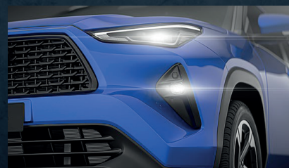
Faros delanteros y traseros "full LED"