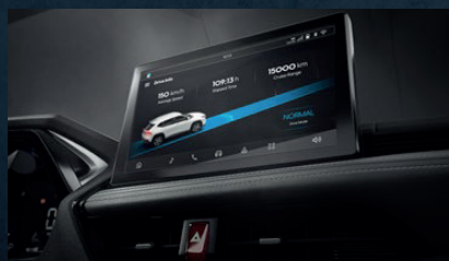
Pantalla táctil de 10" con conectividad inalámbrica*: Apple CarPlay® y Android Auto®