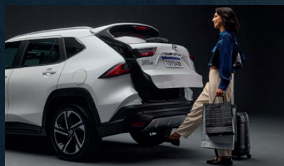
Portón trasero con sistema de apertura y cierre eléctrico con sensor "manos libres"