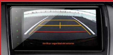
Cámara de reversa. (1)