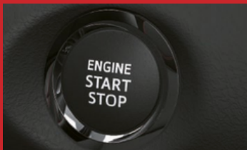
Smart Key – Acceso al vehículo sin llave y arranque por botón. (2)