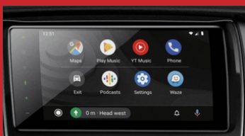
Audio con pantalla táctil de 6.8" con Apple Car Play & Android Auto, Bluetooth y puerto USB (1)