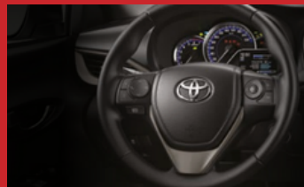
Volante multifunción. (1)