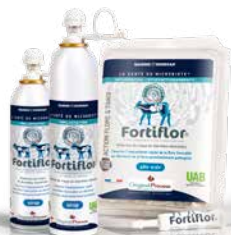
Fortiflor® Pâte orale et sirop

UAB Utilisable en Agriculture Biologique