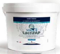
LactiFAP® Poudre soluble