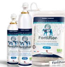
Fortiflor® Pâte orale et sirop

UAB Utilisable en Agriculture Biologique