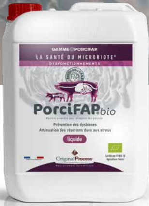
Bidon de 5 et 10 litres