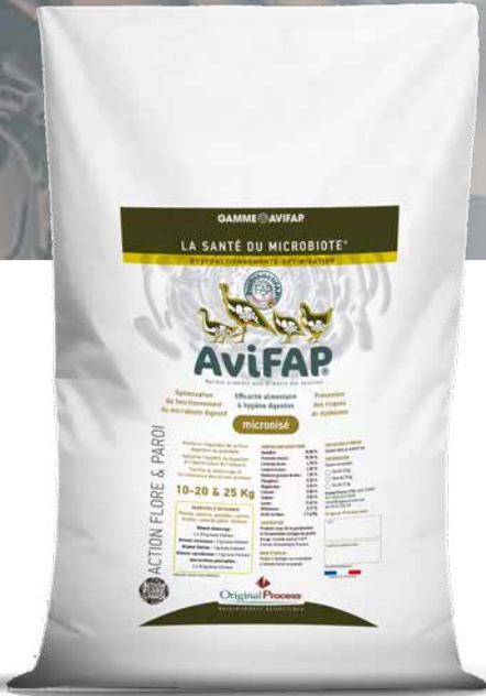
Sac 10-20 & 25 Kg