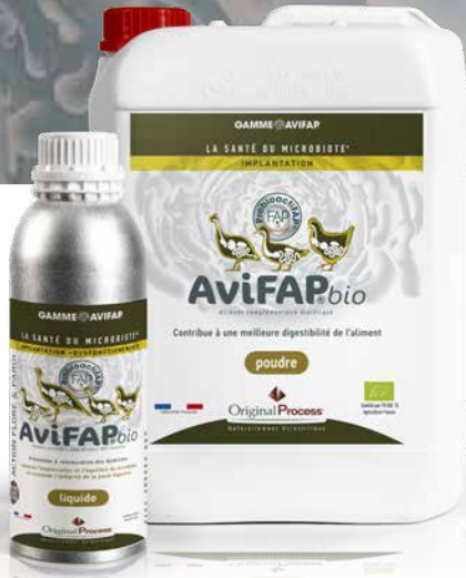
Bidon de 5 et 10 litres et flacon de 1 litre