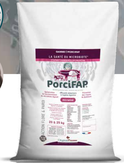
Sac de 25kg

ÉQUILIBRE DE LA FLORE & INTEGRITÉ DE LA PAROI DIGESTIVE