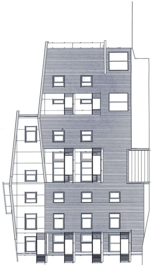
2 Øst 1 : 100