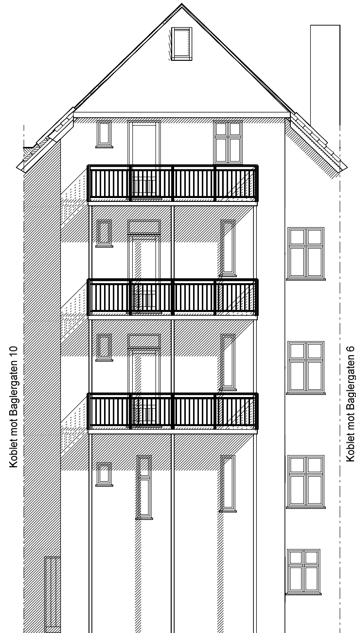
FASADE MOT NORD-VEST Ny situasjon