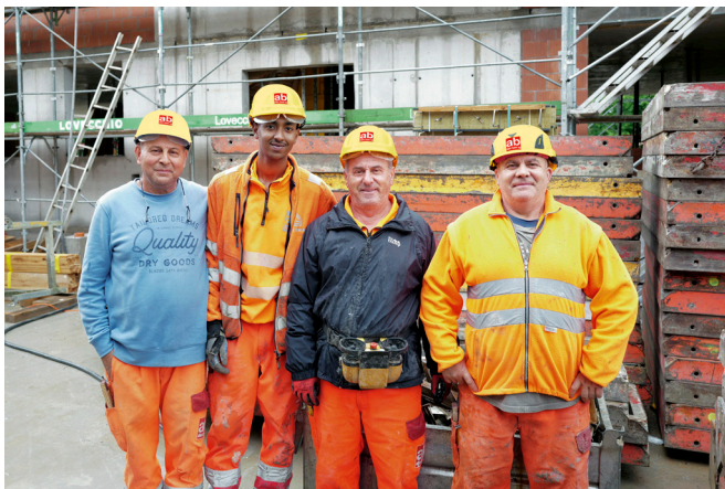
Tüchtige Mitarbeiter der Albin Borer AG, Erschwil.