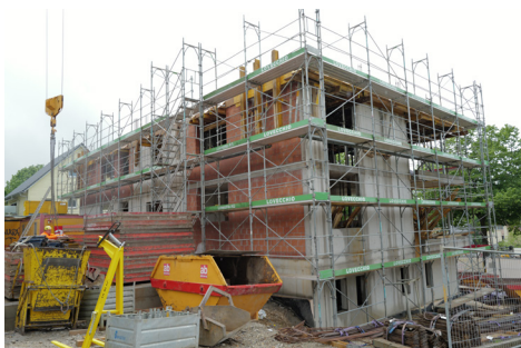
Der Rohbau ...