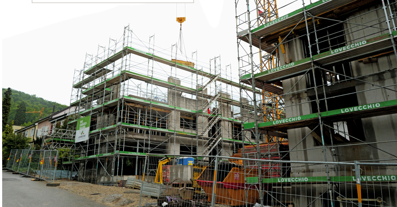
... der zwei Mehrfamilienhäuser mit insgesamt zwölf Wohnungen steht bereits.