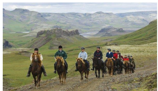
Abbildung 5: Reittouren Island

Islands Pferdesektor leidet seit langem unter geringen Gewinnen. Forschungen zeigen, dass Pferdetourismus-Betreiber mehr am Umgang mit Pferden interessiert sind als an geschäftlichen Aspekten. Ähnliche Trends gibt es auch in anderen Ländern Europas. Dort dominieren persönliche Interessen und Überzeugungen die Entscheidungen, anstatt auf wirtschaftliche Überlegungen zu setzen. Akteure im