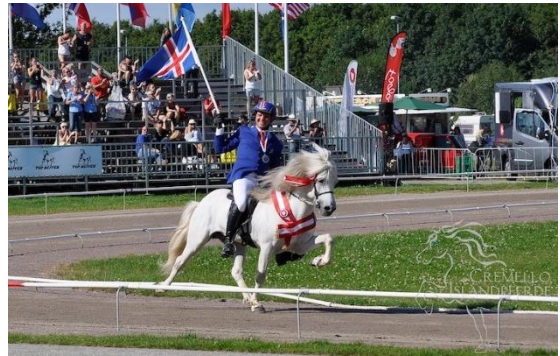
Abbildung 6: Islandpferde WM 2015

Pferdeveranstaltungen sind bedeutsam, um Produkte und Dienstleistungen zu bewerben und die Subkultur der Branche zu feiern. In Island lassen sich die wichtigsten Veranstaltungen traditionell in vier Kategorien einteilen: Zuchtschauen, Sportwettbewerb, Pferdeshows, sowie Pferdetreffen oder Round-ups. Viele dieser Veranstaltungen haben eine lange Tradition und reichen Jahrhunderte zurück. 20