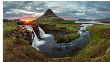
Abbildung 1: Landschaft Islands

Island ist die drittgrößte Insel im Nordatlantik und umfasst eine 200 Seemeilen breite Wirtschaftszone entlang seiner Küste, die reiche Fischgründe beherbergt und eine wichtige wirtschaftliche Ressource für das Land darstellt. Die Bevölkerung von etwa 376.000 Einwohnern (Stand 2022) lebt verteilt in Tälern und den Flachlandebenen im Süden und Südwesten Islands. Denn fast vier Fünftel des Landes sind unbewohnt. Die