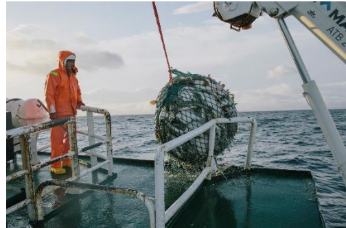
Abbildung 2: Island Fischerei

Islands Küstengewässer bieten herausragende Voraussetzungen für die Fischerei. Eine dieser einzigartigen Gegebenheiten ist das Zusammentreffen von zwei Meeresströmungen, die ein ausgewogenes Mischverhältnis des Wassers schaffen und damit die Lebensbedingungen im Meer erheblich verbessern. Obwohl die Fänge der Fischerei von Jahr zu Jahr variieren, bleibt die Fischerei ein dominierender Wirtschaftszweig und trägt mit einem Anteil von