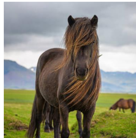
Abbildung 3: das Islandpferd mit typisch länger Mähne

Das Islandpferd zeichnet sich durch seine fünf verschiedenen Gangarten aus, die neben den gängigen Schritt, Trab und Galopp auch den Pass und den Tölt einschließen. Im Gegensatz zum Trab, bei dem die diagonalen Beinpaare den Boden berühren, werden beim Pass die Beine jeweils auf der gleichen Seite synchron aufgesetzt, das heißt, vorne links zusammen mit hinten links und vorne rechts zusammen mit hinten rechts. Der Tölt ist ein 4-Takt und kann mit dem Schritt verglichen werden. In dieser Gangart bewegen sich die Beine einzeln, jedoch im Tölt schneller als im Schritt. Dies ermöglicht eine reibungslose Fortbewegung ohne Erschütterungen, was für den Reiter insbesondere im unebenen Gelände äußerst komfortabel ist. Die Vielfalt der Gangarten spielt eine entscheidende Rolle in der Zucht, Ausbildung und Vermarktung des Islandpferdes. In den offiziellen Zuchtzielen wird besonderer Wert auf einen leichten Körperbau, starke Muskulatur und Beweglichkeit gelegt, um die Bandbreite der Gangarten zu fördern. Diese beeindruckende Vielseitigkeit macht das Islandpferd zu einem fesselnden Sportpferd und bildet die Grundlage für Zuchtprogramme, sportliche Wettbewerbe