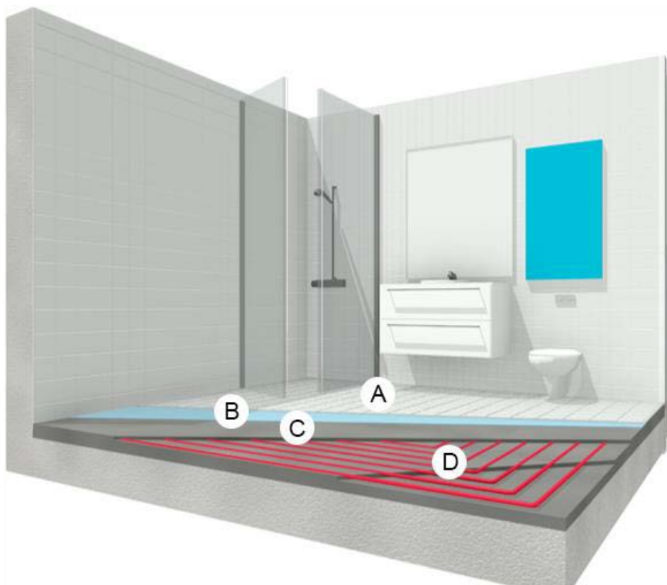
Figur 3: Leggemønster for bad