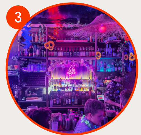
3 Afterwork ? Direction La Grosse Caisse, un bar animé ambiance 80s/90s