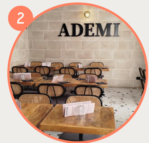
2 Au déjeuner, foncez manger une bonne pizza chez Ademi