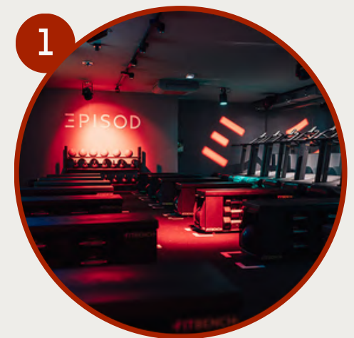
1 Besoin de se défouler après le travail ? Direction Episod Bourse