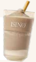
Frozen cappuccino met witte chocoladesaus € 6,50