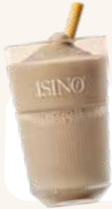
Frozen cappuccino original € 6,00