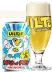
Uiltje Bird of Prey IPA 0.2 € 4,95

Swinkels 0.0 € 3,40 Bavaria Radler 0.0 € 3,95