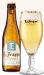
La Trappe Epos 0.0 € 4,95