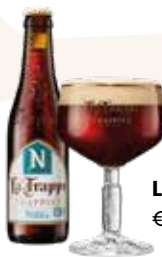
La Trappe Nillis 0.0 € 4,95