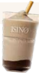
Frozen cappuccino met donkere chocoladesaus € 6,50