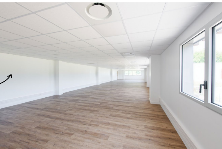
Bureaux en mezzanine