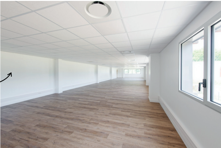
Bureaux en mezzanine