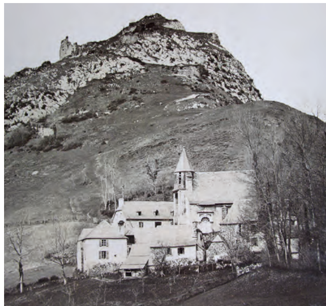
Vue de Cotdoussan en 1892 (ADHP 37 Fi 7).