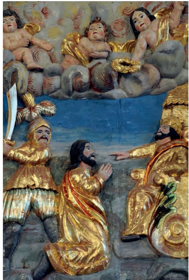
Volet droit du retable, le martyre de saint Jacques.

La porte du tabernacle montre le Christ en croix avec la Vierge Marie et saint Jean. On trouve ensuite deux panneaux : l'Annonciation et l'Assomption de la Vierge, encadrés de statuette (de g. à d.) : saint Jacques, saint Pierre (?), saint Jean-Baptiste, saint Matthieu. En partie haute, la niche d'exposition abrite une Vierge à l'Enfant, entourée de deux frontons avec sainte Barbe et sainte Catherine. En haut domine le Christ ressuscité.