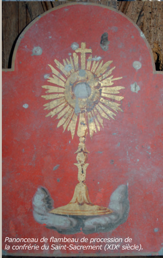
Panonceau de flambeau de procession de la confrérie du Saint-Sacrement (XIX e siècle).