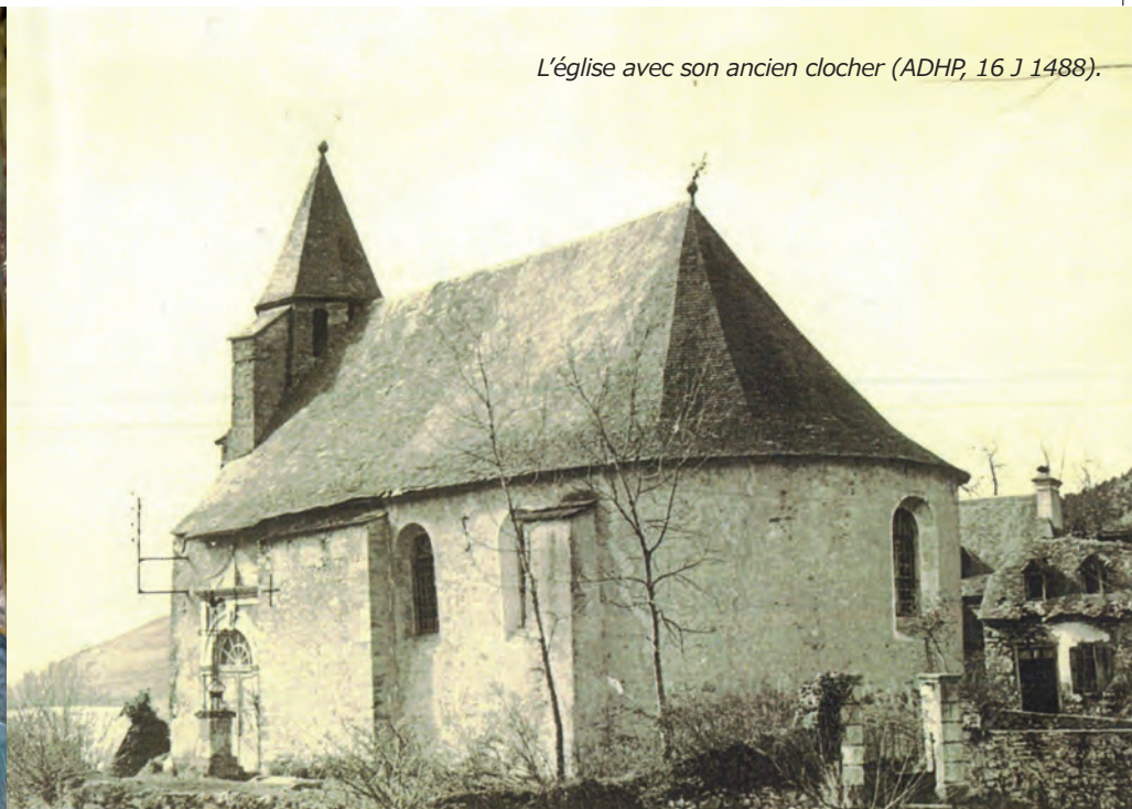
L'église avec son ancien clocher.