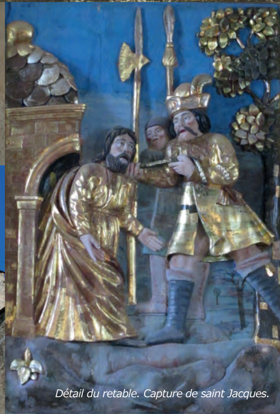
Détail du retable. Capture de saint Jacques.