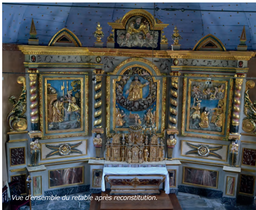
Vue d'ensemble du retable après reconstitution.