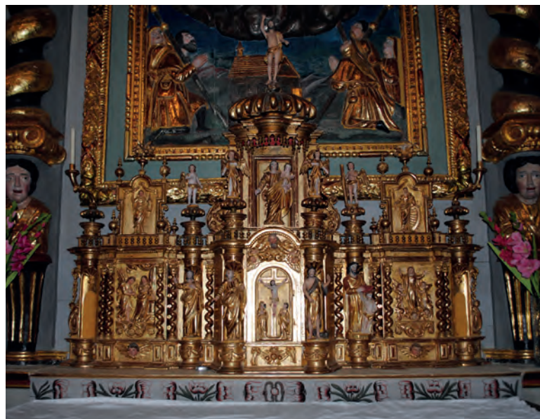
Le tabernacle du maître-autel.

Demeurent encore dans l'église un meuble de sacristie, un coffre de fabrique* à trois clés, un crucifix, une statuette de la Vierge.