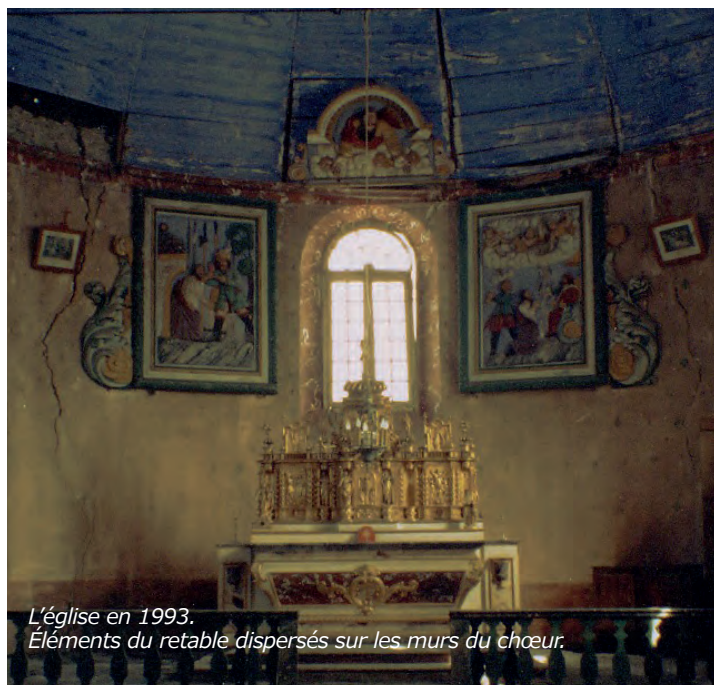
L'église en 1993. Éléments du retable dispersés sur les murs du chœur.

À l'origine, la boiserie devait être appuyée directement au mur de l'abside. Elle a été avancée de quelques mètres afin de laisser libre la fenêtre du chœur* et ménager une sacristie* à l'arrière.