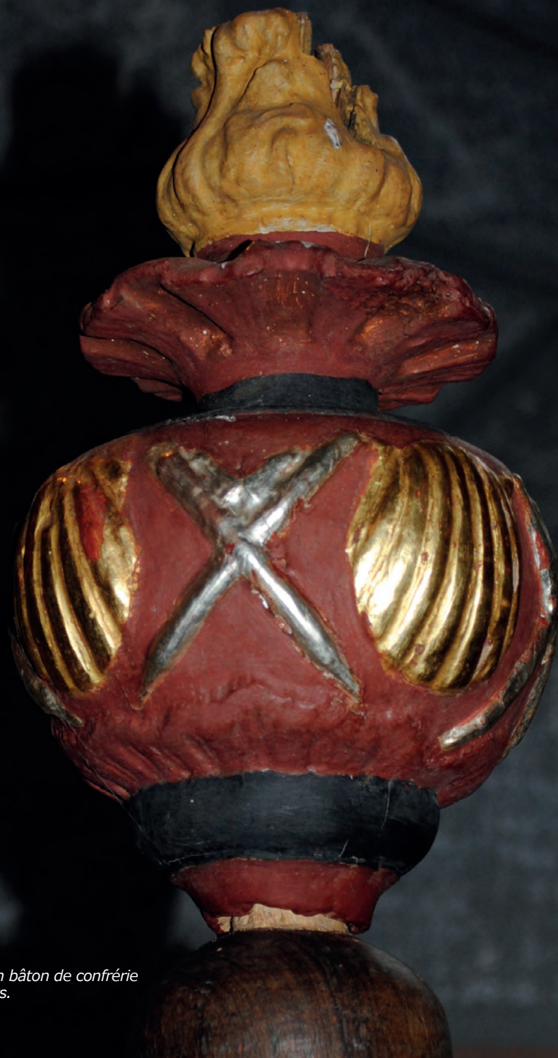
Élément incomplet d'une croix ou d'un bâton de confrérie à décor de coquilles et de bourdonnets.