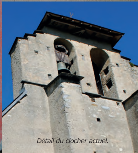
Détail du clocher actuel.