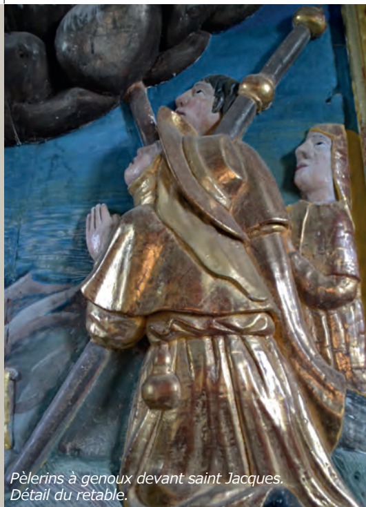
Pèlerins à genoux devant saint Jacques. Détail du retable.