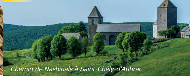
Chemin de Nasbinals à Saint-Chély-d'Aubrac