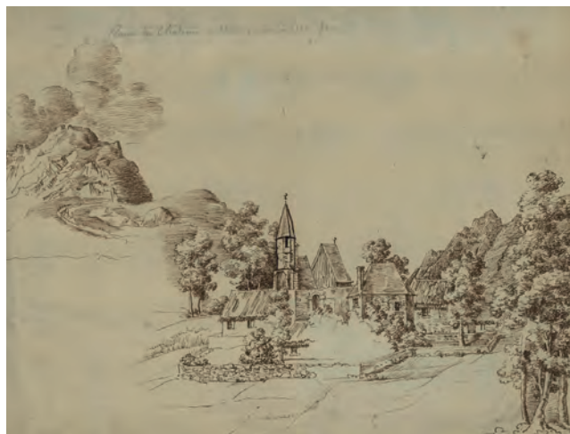
Cotdoussan au début du XIX e siècle. (Dessin Leleu, ADHP 27 Fi 50).

Dans les années 1990, cet ensemble sculpté subsistait toujours sous la forme d'épaves dispersées en plusieurs points de l'église : chœur*, chapelles de la nef ... et dans un ancien coffre de fabrique*.