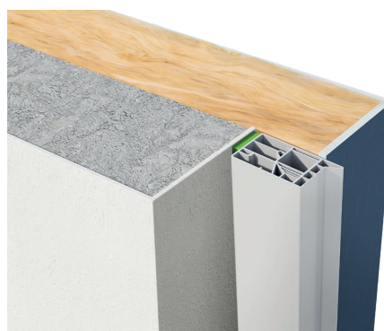
Tunnel au nu extérieur - ITE sans retour