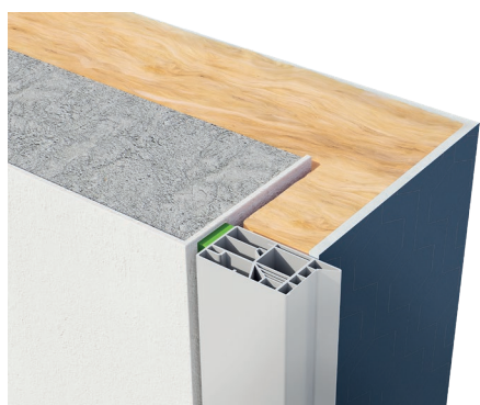
Tunnel au nu intérieur - ITE avec retour