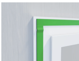
Respecter une surlongueur de 1 cm par jonction