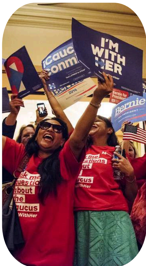
@THE NEW YORKER

Los antiguos griegos creían que el debate era algo sumamente importante. Refrescar y ventilar ideas puede ser útil para compartir diferentes puntos de vista y comprender la perspectiva de otras personas. De igual manera se hace uso del razonamiento y al compartir posturas y compararlas con las de tus compañeros, puedes rehacer tus ideas.