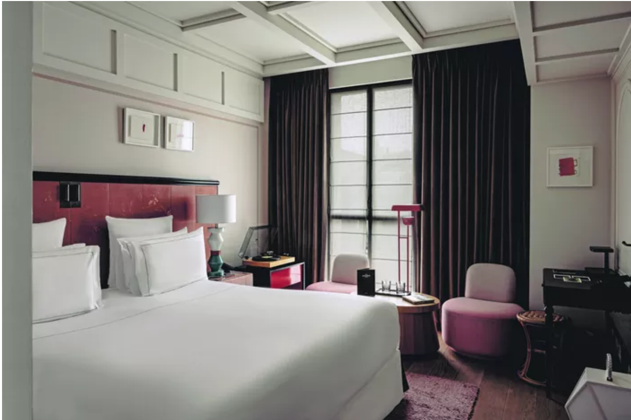
Hôtel Experimental Marais (3e). Mr.Tripper