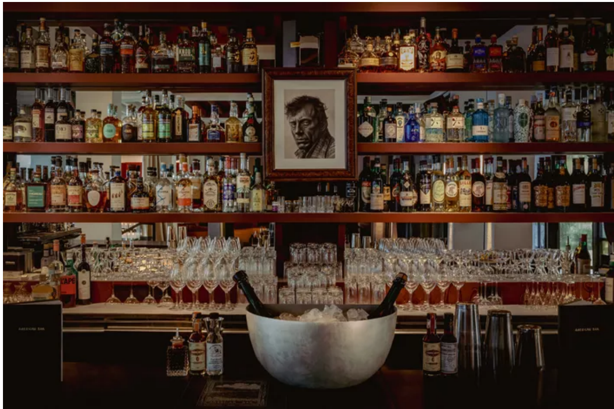
Bar de l'Experimental Marais (3e).