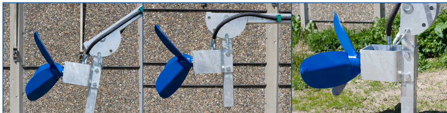
Tilvalg: Tre indstillinger på propellen - for optimal omrøringseffekt