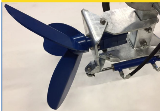
Vinkelindstilling af propel