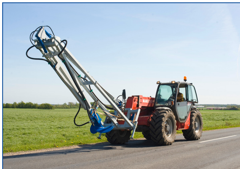
Transportstilling når omrører skal flyttes til næste tank