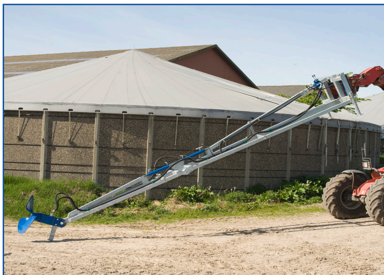
XL-omrører i fuld længde klar til omrøring