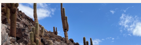
Cardón Echinopsis atacamensis