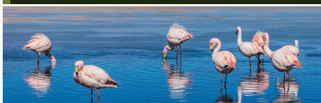
Flamenco andino Phoenicoparrus andinus · Laguna Chaxa