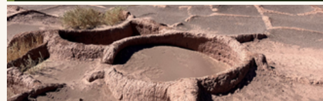
Aldea de Tulor 2.500 a.C. · Sitio arqueológico