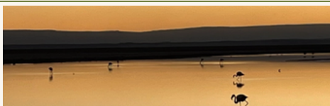
Laguna Chaxa Salar de Atacama · Flamencos