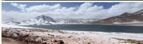
Lagunas Miscanti 4.140 msnm · Volcanes