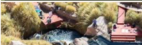
Termas de Puritama 3.500 m · Arq. Germán del Sol