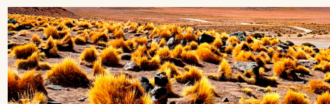
Paja brava Festuca orthophylla