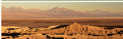
Valle de la Luna San Pedro · Puesta de sol