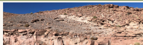
Quebrada de Kezala Talabre · Geoglifos · Cardones