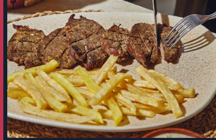
أطباق الشيف الخاصة