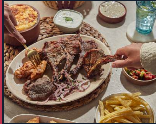
أطباق أبو شقرة المميّزة

مكوّنات فائقة الجودة وأطباق من اختصاص الشيف