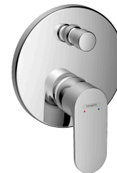
Podomítková baterie: Hansgrohe Rebris S