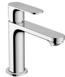
Baterie: Hansgrohe, Rebis S