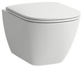
Závěsné keramické WC: LAUFEN „RIMLESS ADVANCED PACK