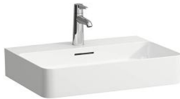
Umyvadlo: LAUFEN, VAL 60x42 cm, bílé