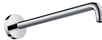
Sprchové rameno: Hansgrohe, chrom