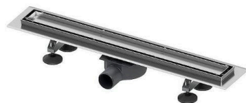
Sprchový žlab: TECElinus s nerez roštem