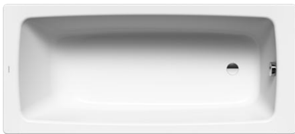
Vana: Kaldewei, CAYONO 750 vana 170x75cm