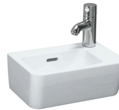
Umývatko: LAUFEN, PRO A 36x25 cm, bílé