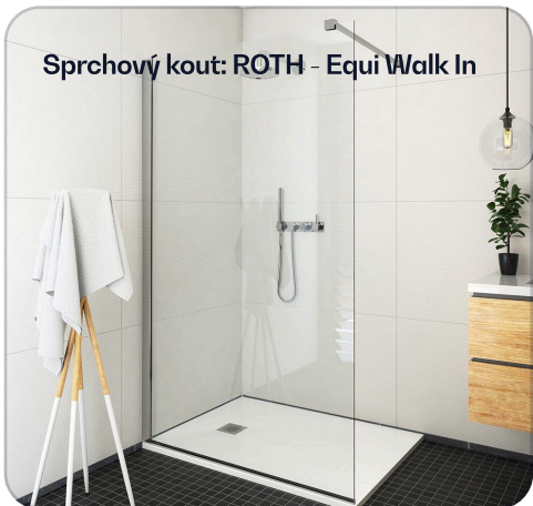
Sprchový kout: ROTH - Equi Walk In