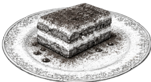
Tiramisu al Cucchiaio