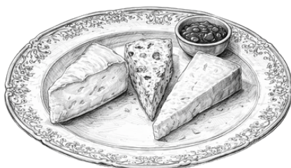
Assiette de fromages