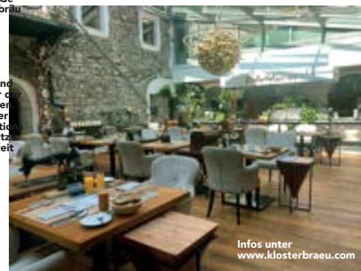
Infos unter www.klosterbraeu.com