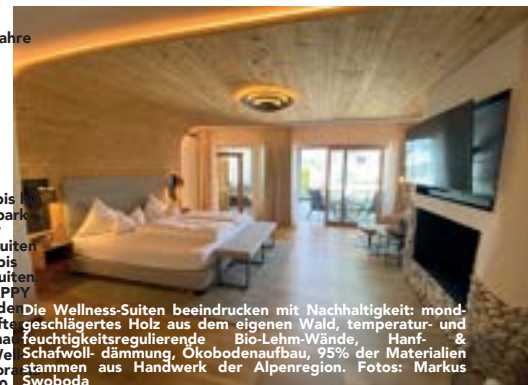
Die Wellness-Suiten beeindruckt mit Nachhaltigkeit: mondgeschlängertes Holz aus dem eigenen Wald, temperatur- und feuchtigkeitsregulierende Bio-Lehm-Wände, Hanf- & Schafwoll-dämmung, Ökobodenaufbau, 95% der Materialien stammen aus Handwerk der Alpenregion.