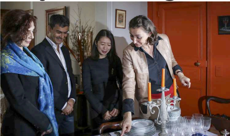
Connaître et placer les fourchettes est un art.

Les agences de tourisme ont rapidement trouvé l'idée très originale : «Elles veulent développer cette idée pour des touristes VIP chinois et américains par exemple.» Selon elle, l'art de vivre français est un moyen de découvrir notre patrimoine : «Derrière le vin, il y a les manufactures de cristal pour les verres, celles de faïence pour les assiettes...» Cette professeure des bonnes manières estime que Versailles se