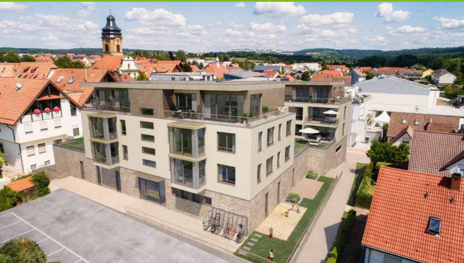
Visualisierung „Neue Ortsmitte“ (WerkGemeinschaft Guttenberger)

Insbesondere die Ansiedlung eines Lebensmittelmarktes ist immens wichtig für die örtliche Nahversorgung. Diesbezüglich wurden an der Beilsteiner Straße/Rathausstraße unter den drei Wohngebäuden über zwei Etagen ein Parkdeck und die Räumlichkeiten für den Lebensmittelmarkt mit ca. 1.700 Quadratmetern Gesamtfläche errichtet.