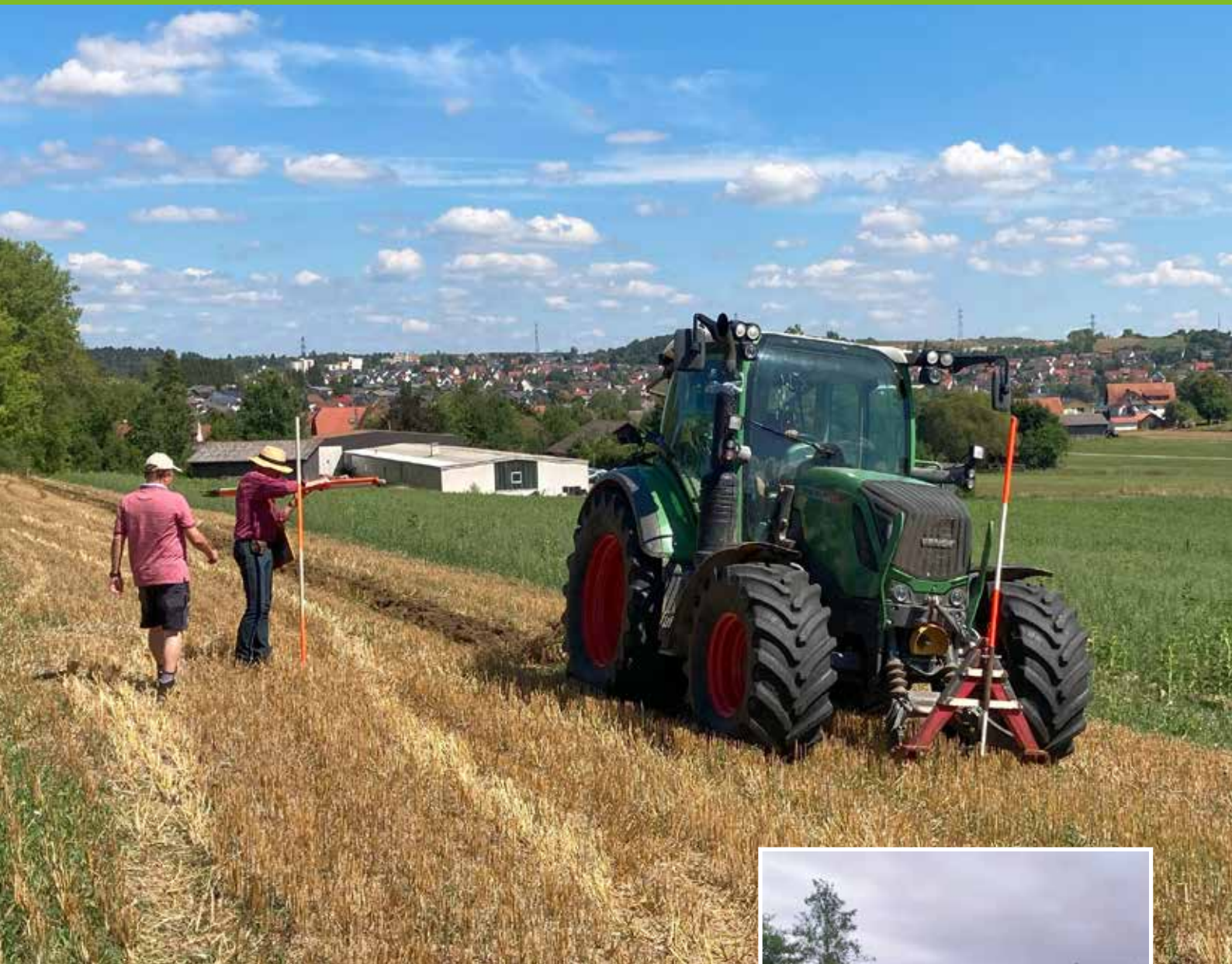
Projektleiter: Thomas Biehler

Außergewöhnlich bei der Zuteilung war die Ausweisung eines 10 m breiten Gewässerrandstreifens in den Talauen entlang der Brigach. Auf ungefähr 3,80 km Länge konnte entlang des Gewässers eine Fläche mit ca. 9,2 ha für das Land Baden-Württemberg (Wasserwirtschaftsverwaltung) bereitgestellt werden. Die Landsiedlung Baden-Württemberg GmbH trug hier maßgebend zum Erfolg dieses Vorhabens bei, indem sie die Kaufverhandlungen mit den Teilnehmern führte.