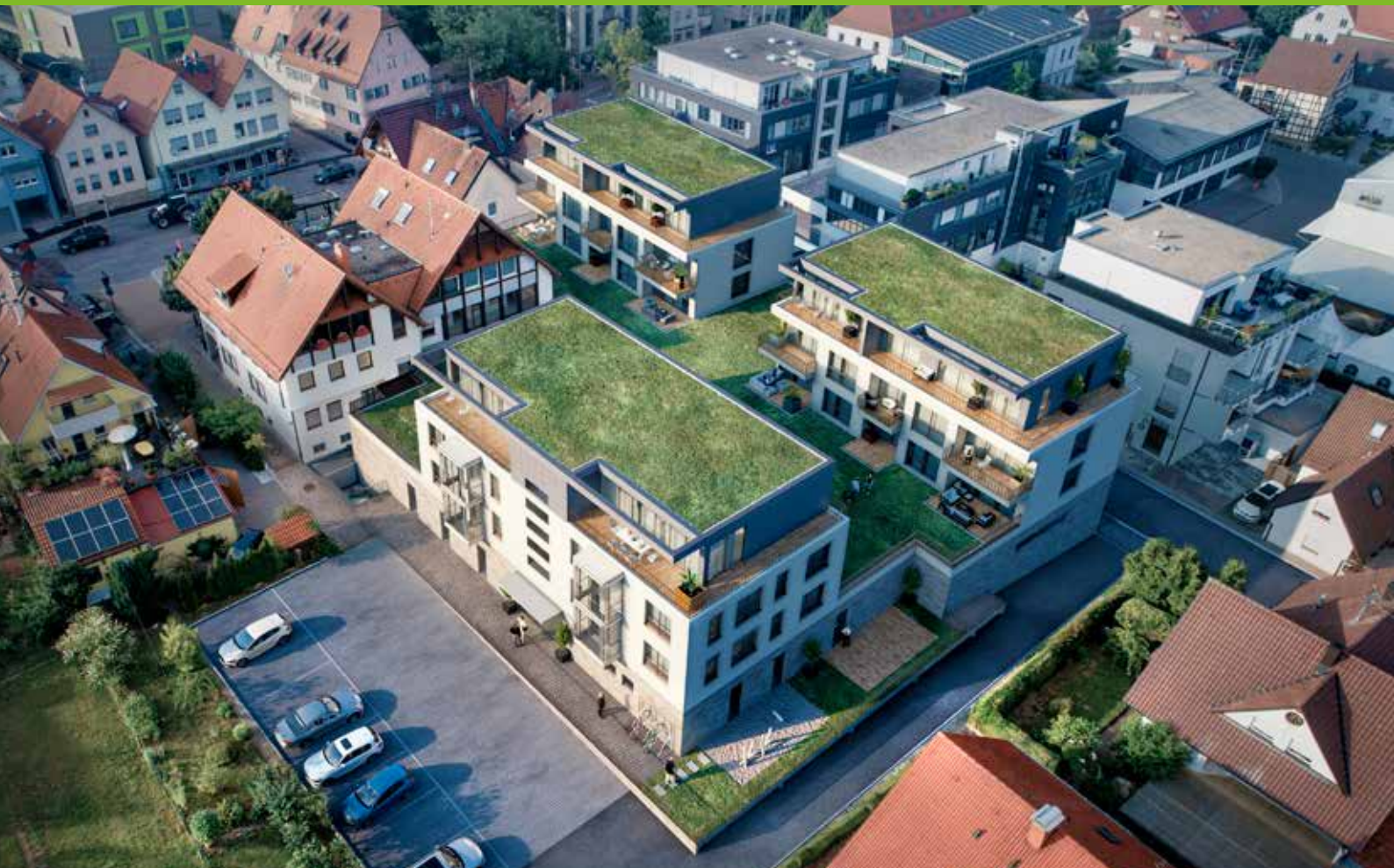
Visualisierung „Neue Ortsmitte“ (WerkGemeinschaft Gutenberg)

Der Baubeginn war bereits im September 2019 und die Fertigstellung, ursprünglich für September 2021 geplant, aber auch während der Bauphase musste die Gemeinde durch die coronabedingten Turbulenzen und aufgrund massiver Grundwasserprobleme manch ernüchternden Rückschlag einstecken.