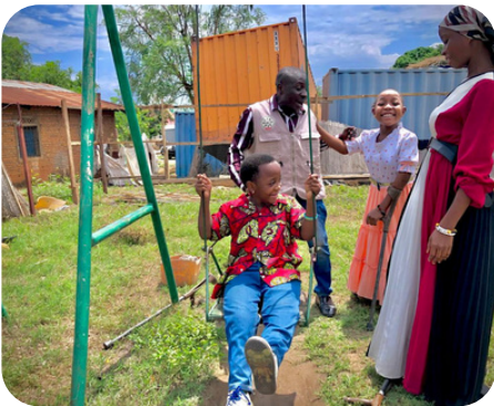
Inclusiviteit van kinderen met een beperking in Oost Congo, © ADED 2025.

DPRP in DR Congo: Via partners ADED en AJEPAD bereiken we 10000+ kinderen met een beperking en hun families. 75.000 moeders kregen toegang tot betere zorg. Meer publieke middelen gaan nu naar disability en preventie (DPRP).