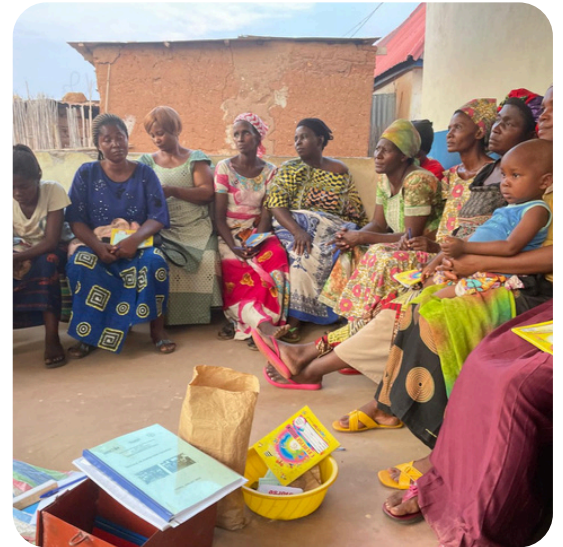
Bijeenkomst van een vrouwen zelf-hulp groep in Goma, DR Congo, © ADED 2025.

Onze kernexpertise ligt in het Disability Prevention & Rehabilitation Programma (DPRP): een gemeenschapsgerichte aanpak die lokale gezondheids-, onderwijs- en sociale systemen versterkt zodat mensen met een beperking volledig kunnen deelnemen aan de samenleving. Met meer dan 25 jaar ervaring en aantoonbare impact is DPRP het bewijs dat een lokaal geleide aanpak werkt, schaalbaar en duurzaam is. De principes die ten grondslag liggen aan DPRP gelden voor al ons werk, in de kern betekent dit dat TUNAFASI samenwerkt met lokale leiders en versterkt wat gemeenschappen en systemen al weten of doen. Of ze nu te maken hebben met een handicap, klimaatverandering of andere vormen van marginalisatie.