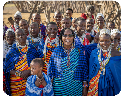
Leadership Pastoral Women's Council in Tanzania, © PWC 2025.

Bottom-up systeemverandering in Kenia en Tanzania: Via Impact Kenya en Pastoral Women's Council: 423 Maasai kinderen naar school, 50 jongeren aan het werk. Lokale leiders bepalen de agenda.