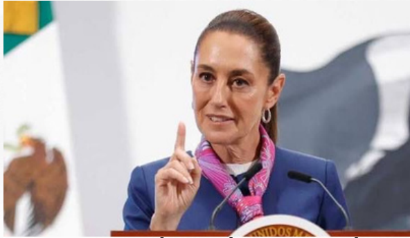
Sheinbaum. Qué pasará en Michoacán