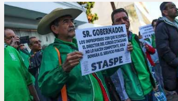
STASPE en una agenda opositora anti Bedolla?