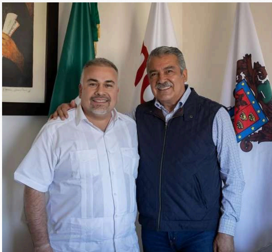
Morena, Mora y Morón se nos rompió el amor.

Nos vamos, gracias por su amable lectura y será hasta la próxima semana cuando estaremos de nuevo con ustedes. Vengan a Las Trojes y aquí nos vemos.