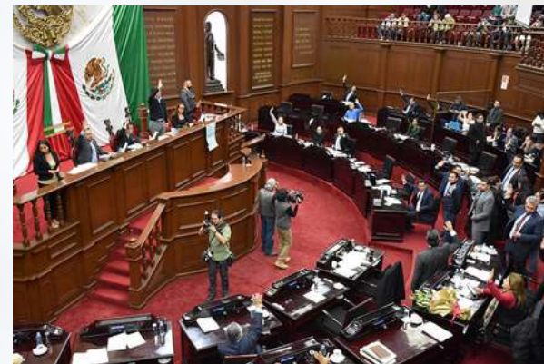
Grupo Parlamentario de Morena, entre grupos e individualidades