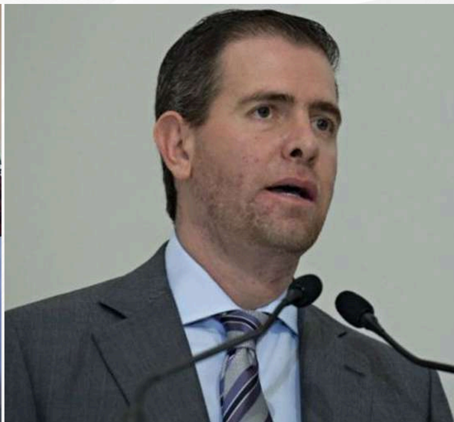
Huele a tiempos de Alfredo Castillo, otro michoacanazo?