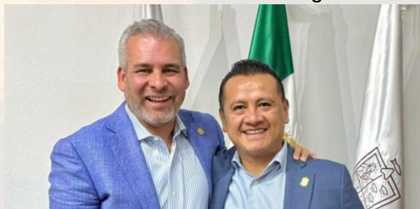
Un viajero del futuro visitó al Gobernador Bedolla

Un amigo se acercó a la mesa para comentarnos sobre la lluvia de encuestas que se difunden estos días en los medios de comunicación de Michoacán. Según su