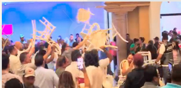
A sillazos reventan asamblea de Morón en Apatzingán

poder judicial y fue interrumpido por un grupo de manifestantes que le reventaron el evento a silletazos. Estos manifestantes, que no eran pocos, llegaron a reclamarle al “Profe” que se está gastando el dinero del pueblo en campaña, entre otros señalamientos. Pues se calentaron los ánimos y, de las palabras subidas de tono, empezaron a volar las sillas contra Morón y su equipo de primera línea. En medio de la trifulca, se escuchó decir al precandidato a la gubernatura de Michoacán que pagaba las actividades de su dinero y con aportaciones de amigos. En la acostumbrada mesa de tertulias de los periodistas de la capital, también se comentaba el evento, aunque allí se referían a la respuesta política que dieron los integrantes del equipo de campaña, puntualmente el Diputado Juan Carlos Barragán, quien responsabilizó de los hechos al presidente municipal de Uruapan, Carlos Manzo, en complicidad con el Gobernador Alfredo Ramírez Bedolla. Por su parte, Morón, de forma más moderada, pidió a las autoridades internas de Morena una investigación para esclarecer el acontecimiento. “Las cosas a lo interno de Morena se están poniendo color de hormiga”, dice el periodista del cabello blanco y arrugas pronunciadas. “Si no ponen reglas claras y detienen la batalla, podrían poner en riesgo el triunfo de Morena en 2027”. Salud al amigo por sus siempre atinados comentarios.