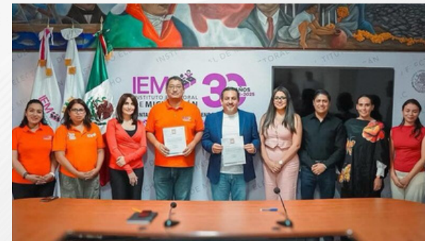
Esperam a MC en las colonias pobres

Dejamos el pomo de bacacho a buen resguardo y nos vamos; será hasta la próxima semana cuando estaremos de nuevo con ustedes desde Las Trojes. Saludos.