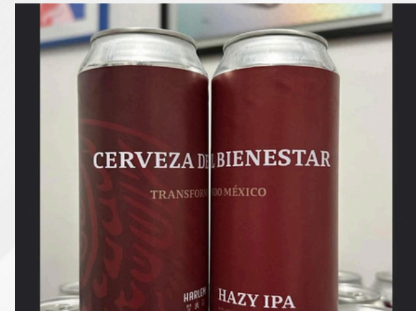
Las chelas del bienestar deben ser incorporadas a los programas sociales