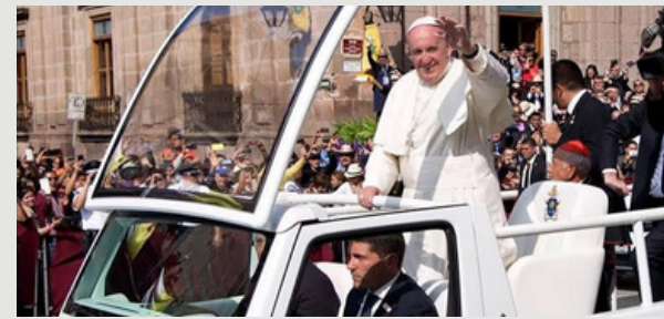
México también llora partida de Francisco.

Muy atento a la mesa estaba el mesero estrella, quien, después de despedir al ilustre visitante, vino a comentarnos que, hablando de disciplina interna, en una mesa que atendió por estas noches, un grupo de figuras de Morena en la región comentaban que este próximo fin de semana se realizará el Consejo Nacional de esa organización que ha sido convocado porque algunos personajes que posiblemente buscarán algún cargo de elección intermedia del año 2027 obligan al