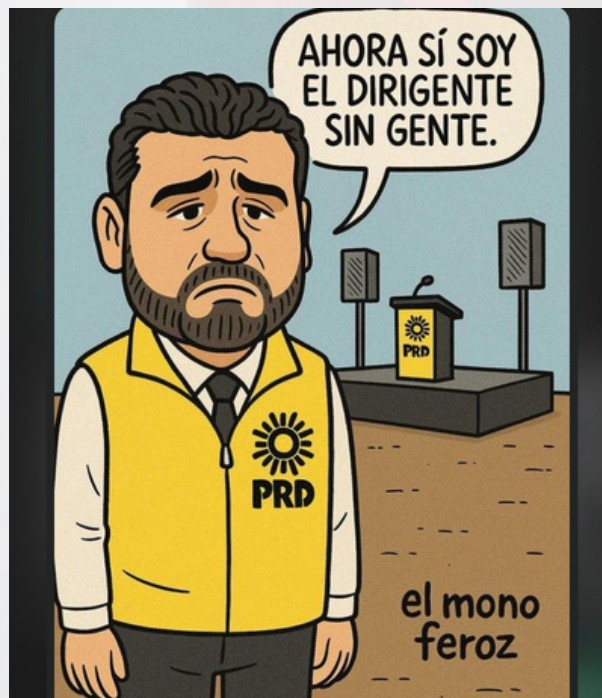
El dirigente sin gente