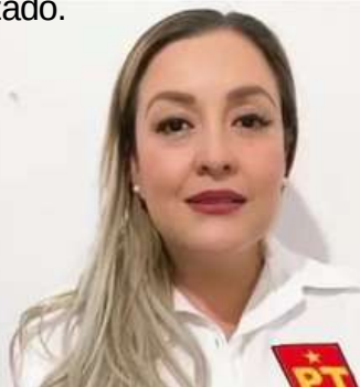
Atacan a otra alcaldesa

Vuelve a quedar en evidencia que Michoacán atraviesa uno de los periodos más violentos de su historia reciente. Entre junio de 2024 y lo que va de 2025, el estado ha experimentado una escalada en homicidios dolosos y ataques directos contra funcionarios públicos, dejando un saldo fatal entre alcaldes, exfuncionarios y dirigentes políticos, en medio del avance del crimen organizado.