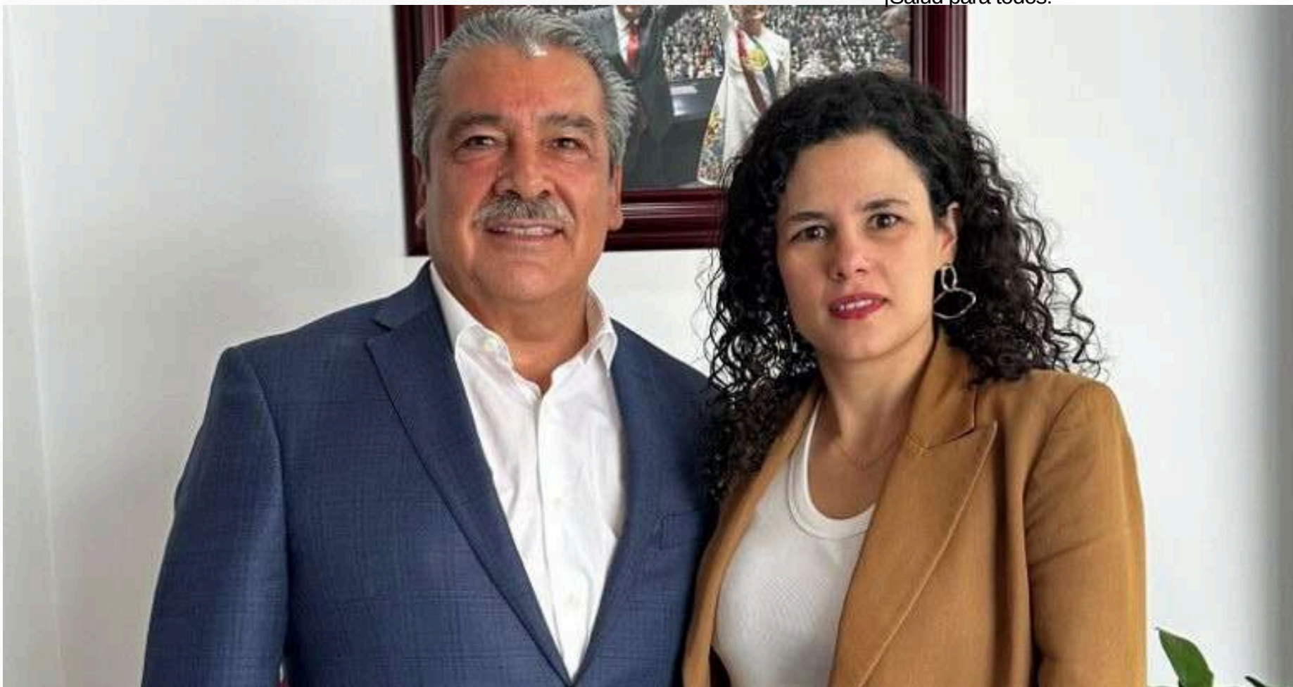
Morón vuelve a mostrar ser el mero mero

Nos vamos. Será hasta la próxima semana, cuando estaremos de nuevo con ustedes, aquí, en Las Trojes... y sí, siempre degustando los mejores sabores. ¡Salud para todos!