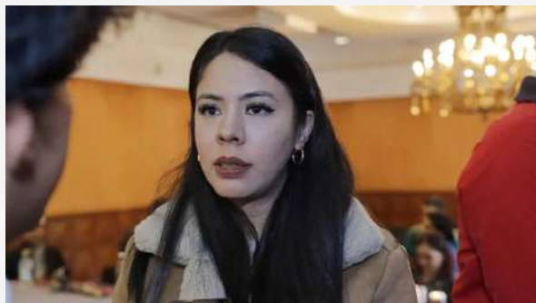
Queréndaro en la nota roja

La promoción entusiasta del concierto de El Tri terminó con el municipio rebautizado como "Querendarock", por lo poco atinado del cartel musical. Ojalá comprendan que no gobiernan el Reino de Barbie. Y es que, como el buen ron Diplomático, la política exige madurez, tiempo y cabeza fría. No espectáculo.